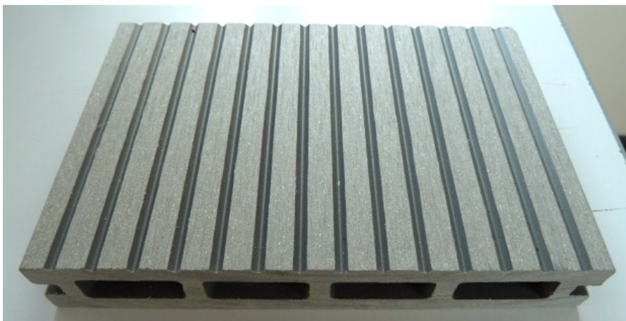
Figura 1 / Figure 1